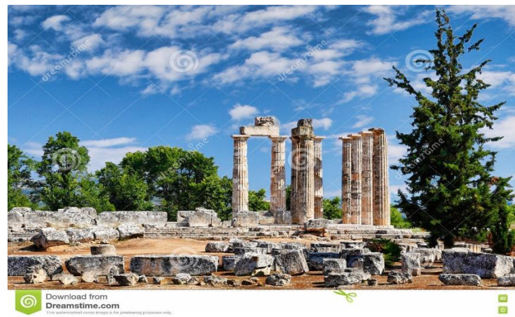
Der Tempel vom ZEUS in NEMEA