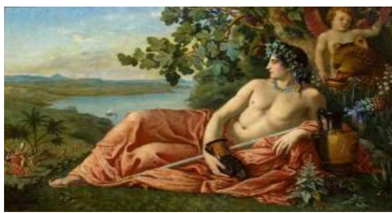
DIONYSOS Gott des Weines