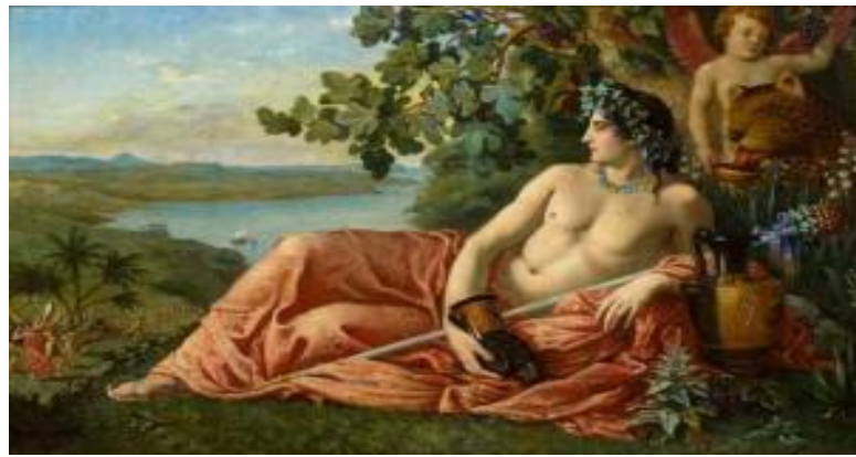
DIONYSOS Gott des Weines